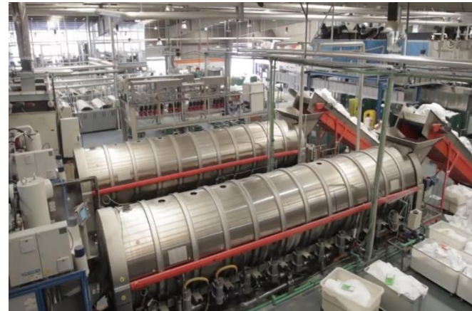
Lavandería El Cardón, Fuerteventura

Renovación de calderas y cambios a combustibles menos contaminante GLP o GN