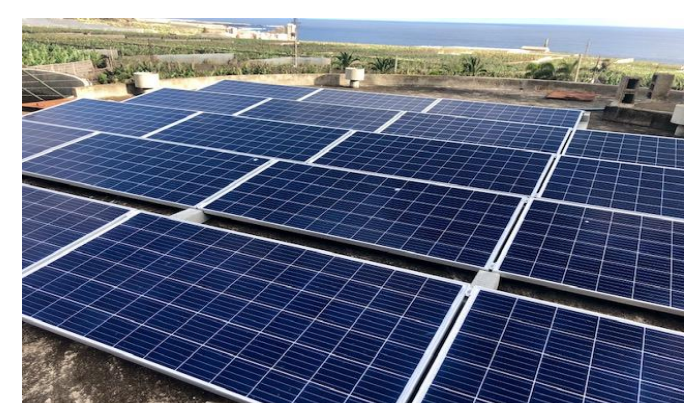
Finca Agrícola El Redondo, Tenerife