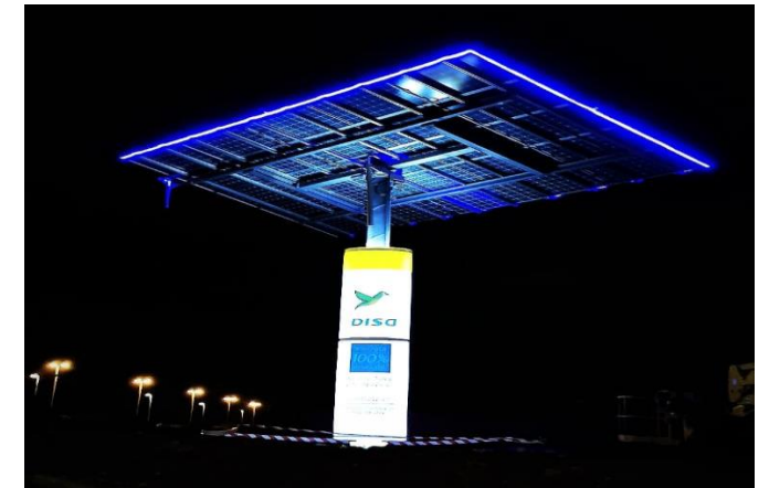
EESS DISA km 21, Gran Canaria

Desarrollo de proyectos de autoconsumo fotovoltaico