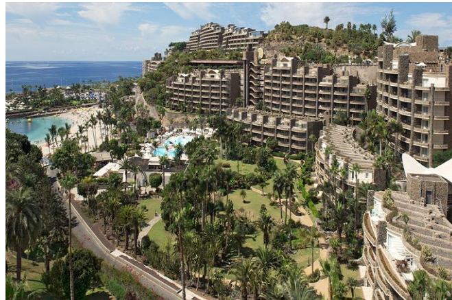
Hotel Anfi del Mar, Gran Canaria

Renovación completa de instalaciones de climatización (calor y frío)