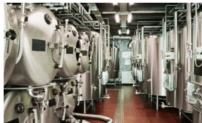
Industria Cervecera Ceintec, Sevilla