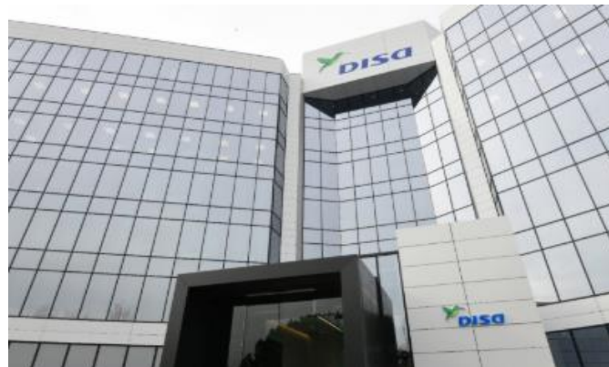
Oficina DISA Río Bullaque, Madrid